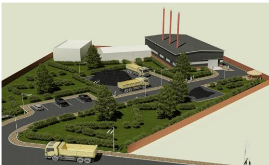
“ЭРДЭНЭС-ТАВАНТОЛГОЙ” ХК-ИЙН УУРХАЙД ШИНЭЭР БАРИГДАХ УУРЫН ЗУУХНЫ БАРИЛГА БАРИХ - ХАЛААЛТЫН ТОГОО УГСРАХ АЖЛЫН ЗУРАГ ТӨСӨЛ, ТӨСӨВ БОЛОВСРУУЛАХ АЖЛЫН ДААЛГАВАР